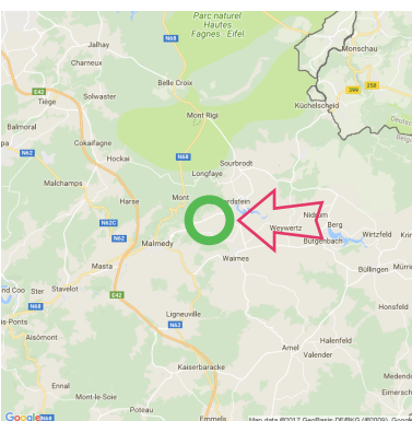
Le Perron (Athena) (20-11-2017)